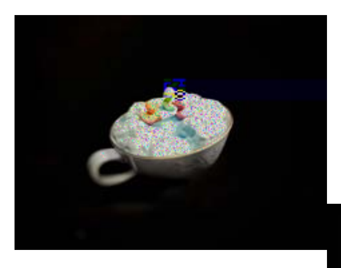
Understanding Over Loss O12, '#34, ' 546)#7&(8#9&: +) 1)#&' #;41#;76);#&9#74, ;# 71(1#;&#4, <<1' #69#;41#<(1=#, '>#<(1>, ;&(# <, (;1>#7, =)#76;4#, #? +;+, #+'>1();, '>6' 2# h\Uh]Zh\Ym [\hhch\YXYUh\h\Ym; YbXid -&)6' 2#? &(1#;4, '#;41=#@, (2,6' 1>#9&(A